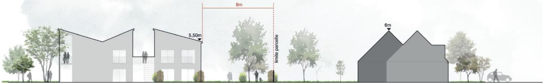
PROFIL SUR MITOYEN - ÎLOT D