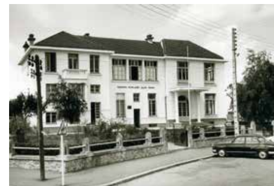
▲ École Jules Ferry - Fonds Dommée, Archives municipales de Saint-Nazaire.

Si vous avez des photographies, des cahiers d'élèves et autres documents de cette période, et particulièrement des années 60 à 80, vous pouvez contacter les Archives au 02 40 00 40 67 ou archivesdoc@mairie-saintnazaire.fr