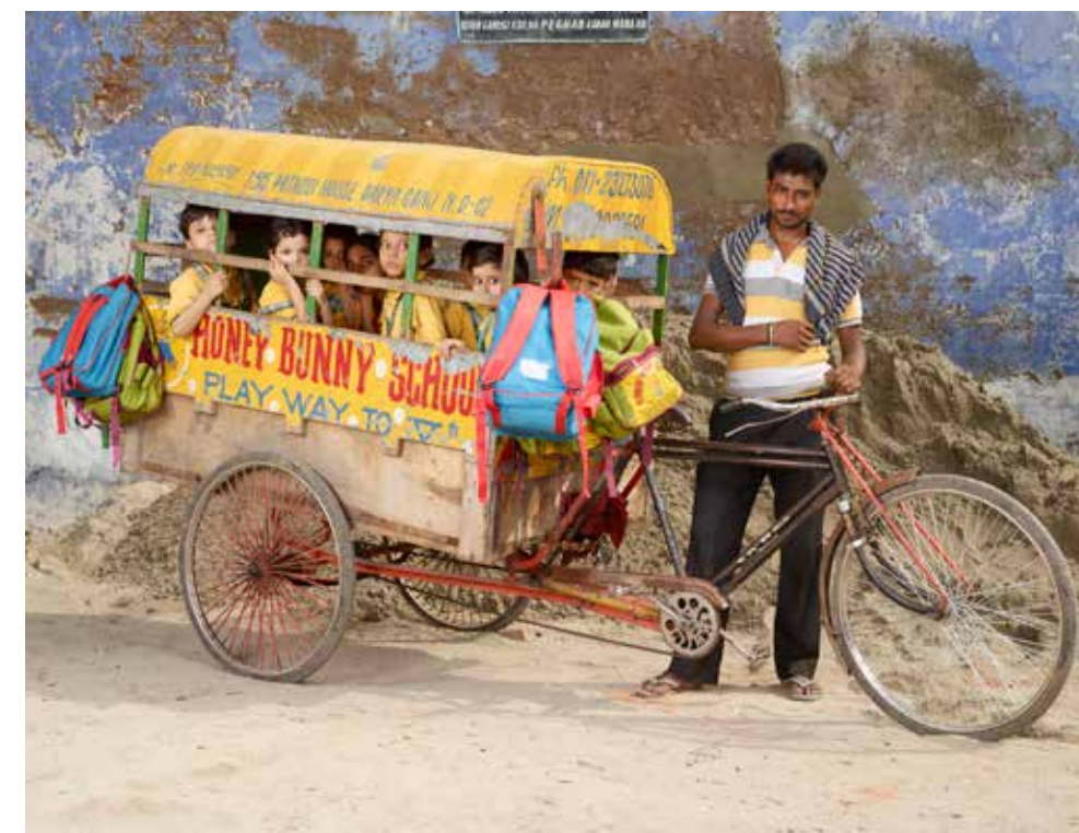
Le photographe Charles Fréger a choisi de mettre en lumière un quartier de New Delhi. Il dresse un portrait chamarré de jeunes Indiens en route vers l'école.

Retour aux sources pour l'ensemble de ces clichés d'ici et d'ailleurs : saisis