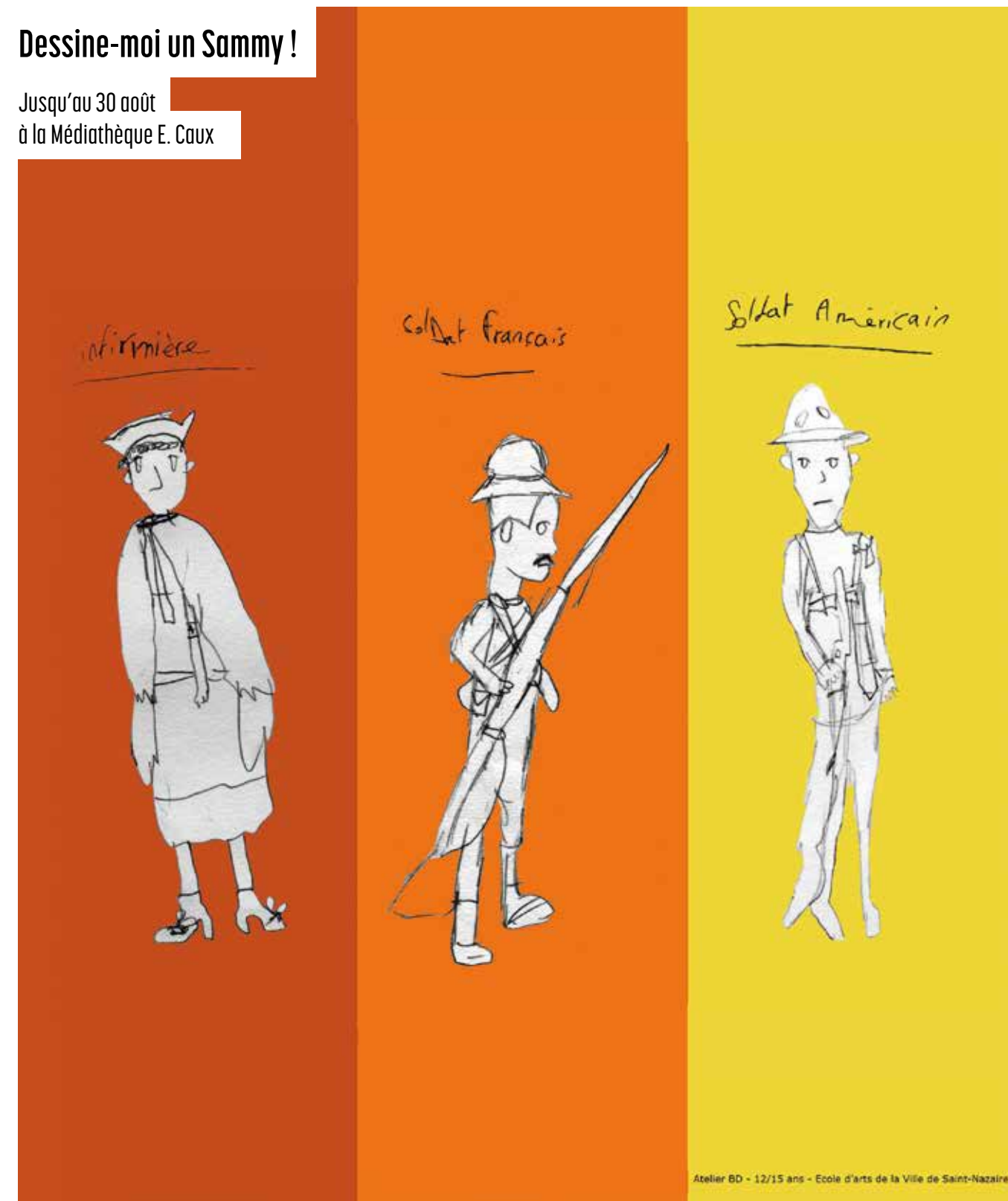
Atelier BD - 12/15 ans - Ecole d'arts de la Ville de Saint-Nazaire

Jusqu'au 30 août à la Médiathèque E. Caux