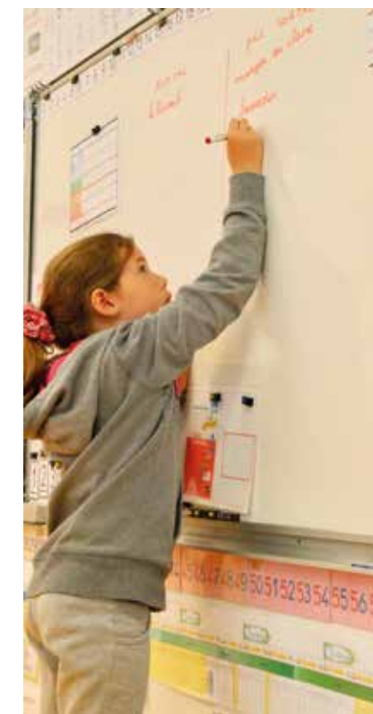
Pendant l'été, les écoles se font une beauté pour accueillir dans les meilleures conditions les élèves à la rentrée.

Une remise en état est réalisée dans la cour de l'école maternelle Albert Camus. Un nouveau jeu et un bac à sable y sont installés.