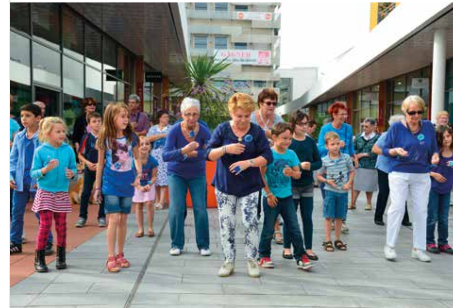
La Semaine Bleue à Saint-Nazaire