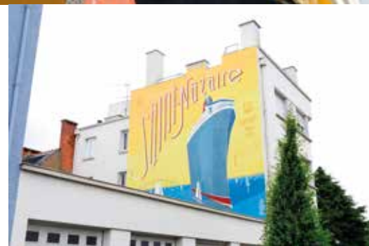
▼ Les Toqué Frères

À l'occasion des deux temps forts qui ont marqué l'été à Saint-Nazaire, The Bridge et le festival Les Escales, des street artistes sont venus colorer les façades de la ville . Invités par le bailleur social Silène, les Toqué Frères ont réalisé une fresque pleine de couleurs et de bonne humeur sur une façade de la résidence Le Suez, 73 avenue Ferdinand de Lesseps. L'artiste plasticienne Ellen Rutt , quant à elle, est venue tout droit de Detroit (Michigan, USA) pour réaliser une fresque monumentale sur le pignon de l'immeuble Panama, 10 rue Henri Gautier.