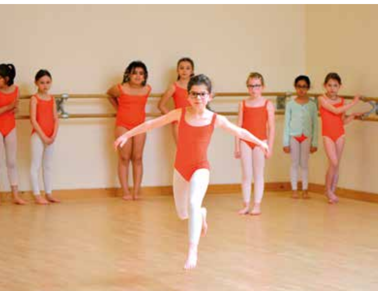
Musiciens et danseurs du Conservatoire vont bénéficier d'un auditorium en 2020.

« Cette logique d'ouverture concerne les futurs partenariats, les principales institutions dont il faut encore faciliter l'accès, et les espaces publics où s'exprimera demain, encore un peu plus, la culture sous toutes ses formes », poursuit-t-il.