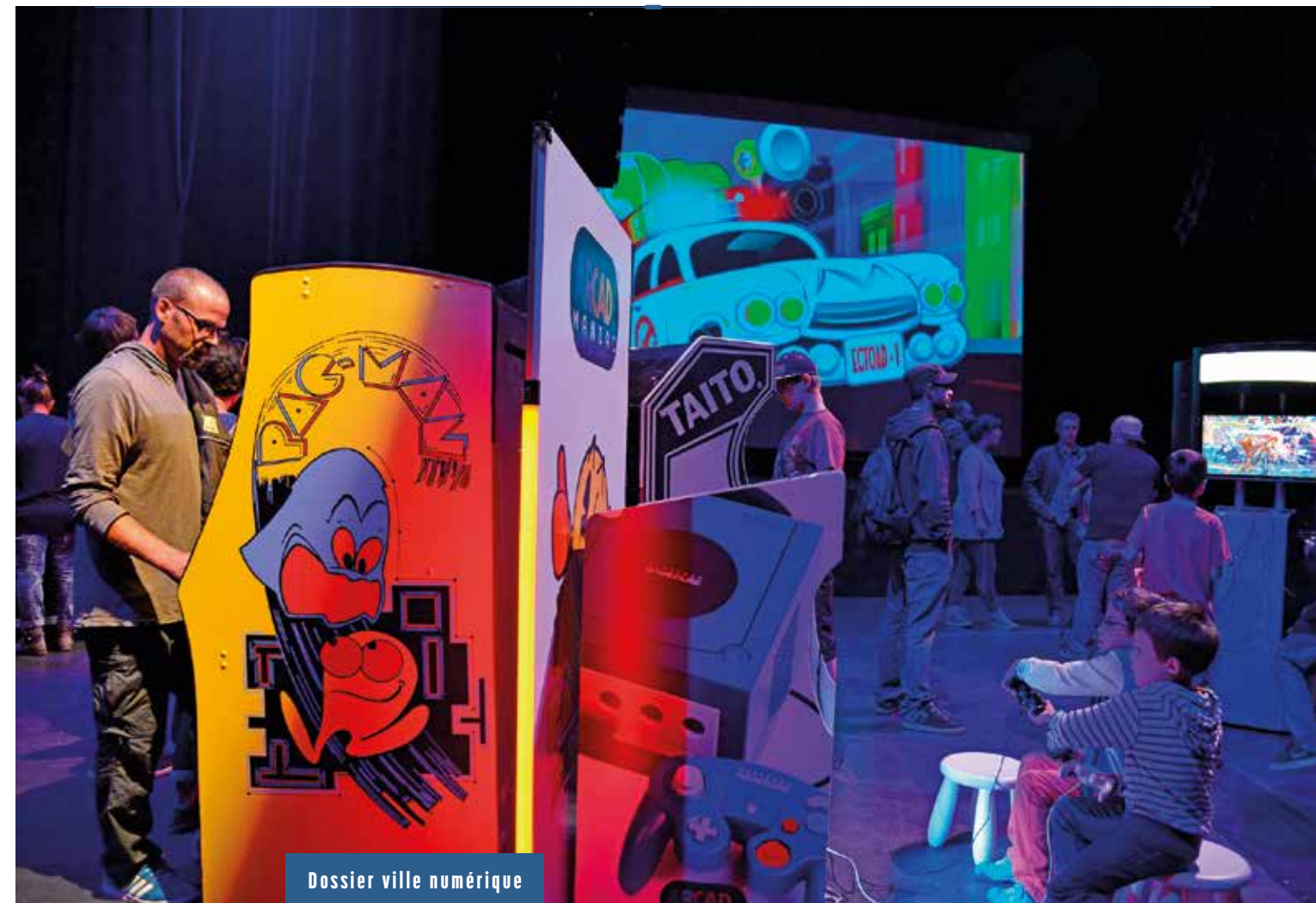
Dossier ville numérique

Des jeux hors normes seront mis à disposition dans la salle du VIP