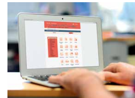
Le site saintnazaire.fr pour faciliter le quotidien

* Pour signaler toute intervention urgente par téléphone : 02 40 00 38 28