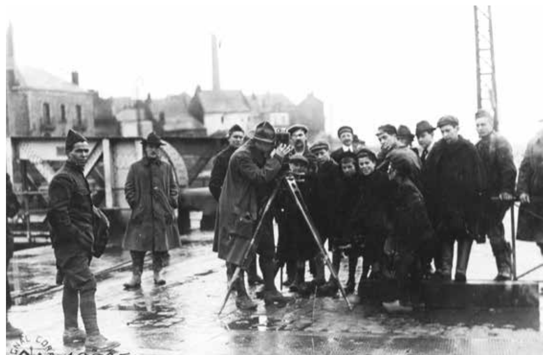
◀ Avec l'exposition Little America, Saint-Nazaire replonge dans le passé et retrace le passage des Américains à Saint-Nazaire, il y a 100 ans.

Pour ce grand rendez-vous annuel proposé du 13 au 17 septembre, Saint-Nazaire Agglomération Tourisme et ses partenaires offrent différents regards sur un patrimoine nazairien atypique. De 1917 à 1950, du centre-ville au quartier Méan-Penhoët, l'édition 2017 propose plusieurs façons de (re)visiter Saint-Nazaire, avec un accent mis sur la jeunesse, thème national.