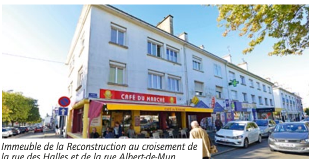
Immeuble de la Reconstruction au croisement de la rue des Halles et de la rue Albert-de-Mun

Ce colloque fut aussi l'occasion de mettre un coup de projecteur sur la valeur patrimoniale des immeubles des années 50-70. Le Havre a montré la voie, avec l'obtention du label « Patrimoine mondial de l'humanité ». Saint-Nazaire a elle aussi en projet de valoriser son parc de la Reconstruction et de le promouvoir auprès des Nazairiens et des visiteurs en obtenant, à l'instar de Lorient ou de Caen, le label « Ville d'art et d'histoire ».