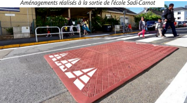
Aménagements réalisés à la sortie de l'école Sadi-Carnot