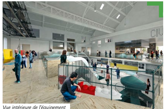
Vue intérieure de l'équipement