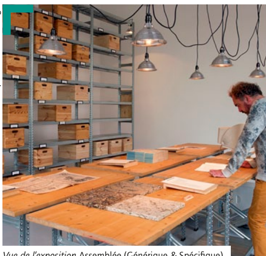
Vue de l'exposition Assemblée (Générique & Spécifique)