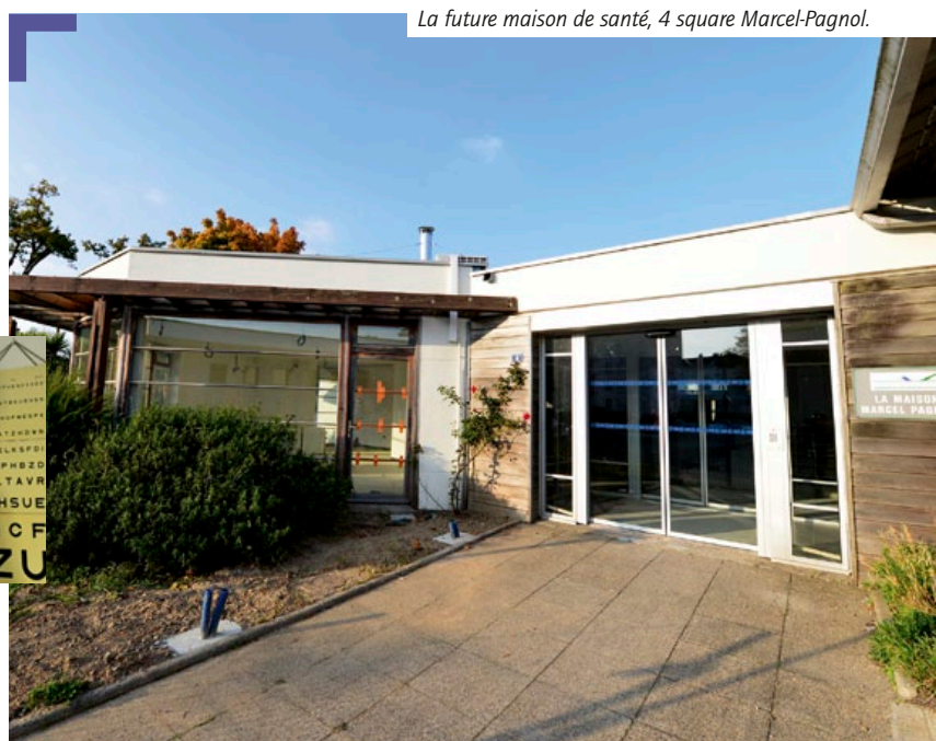
La future maison de santé, 4 square Marcel-Pagnol.

Le partenariat passé entre la maison de santé, la Ville et l'Agence Régionale de Santé repose sur trois règles de fonctionnement: une permanence de soins tous les jours de 8 h à 20 h et le samedi matin de 8 h à 12 h; un dossier informatique commun pour chaque patient; des réunions régulières de coordination et de concerta-