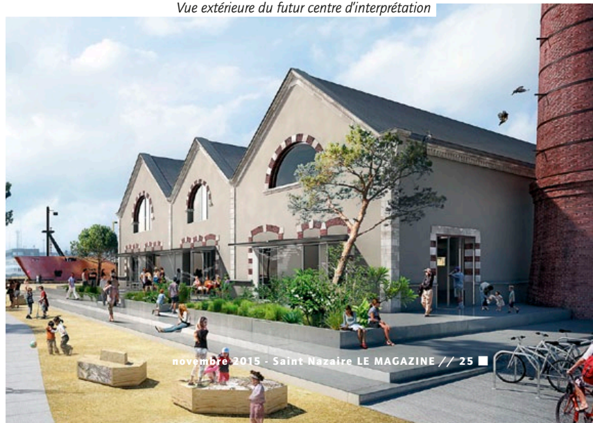
Vue extérieure du futur centre d'interprétation

* Estimés à 9,3 M€ et financés à 100 % par la Région des Pays de la Loire.