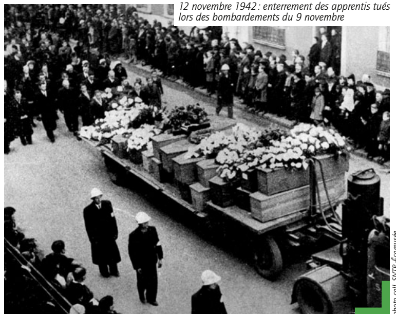
12 novembre 1942 : enterrement des apprentis tués lors des bombardements du 9 novembre

La cérémonie se déroulera à 11 h au cimetière de Toutes-Aides, face à la stèle dédiée au bombardement des apprentis, en présence du maire et des élus, des familles des victimes et de quelques rescapés. Des élèves du collège Albert-Vinçon seront eux aussi présents, après avoir