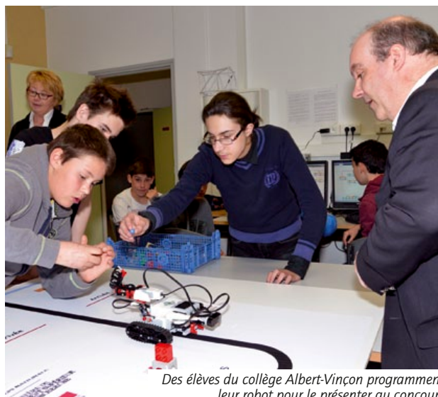
Des élèves du collège Albert-Vinçon programment leur robot pour le présenter au concours