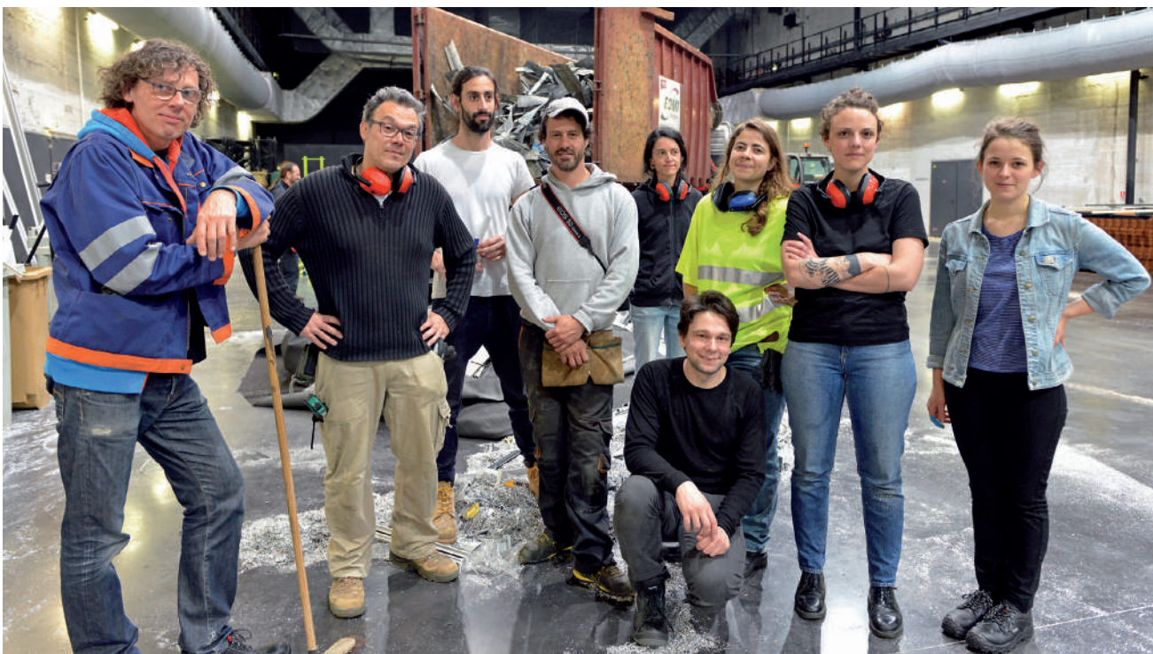
Le collectif allemand Raumlaborberlin a pris ses marques dans l'alvéole 14 de la base sous-marine.

Drôle de nom pour une expo, drôle d'endroit pour une exploration de l'habitat collectif de demain... En partenariat avec Le Grand Café, le collectif allemand Raumlaborberlin a choisi de transformer l'Alvéole 14 en un grand atelier d'assemblage, le temps d'une expérience architecturale inédite.