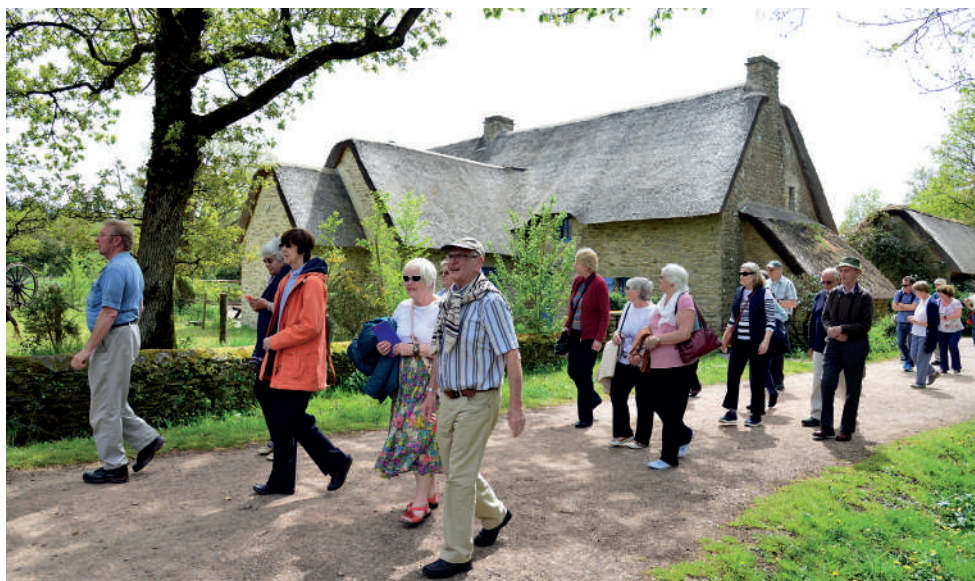
Les touristes britanniques ont pu découvrir lors d'une excursion, tout le charme du village de Kerhinet.