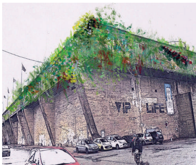
1 er prix catégorie « Idée folle adultes » proposée par Catherine Mallet avec la colonisation du bandeau supérieur de la base sous-marine par des plantes.

Pour cette saison 2015-2016, l'atelier a proposé un grand concours sur le thème de la nature insolite en ville. L'objectif pour les participants ? Témoigner de la présence parfois incongrue de la nature dans la ville et partager leurs idées les plus folles pour la faire entrer à l'intérieur du centre-ville.