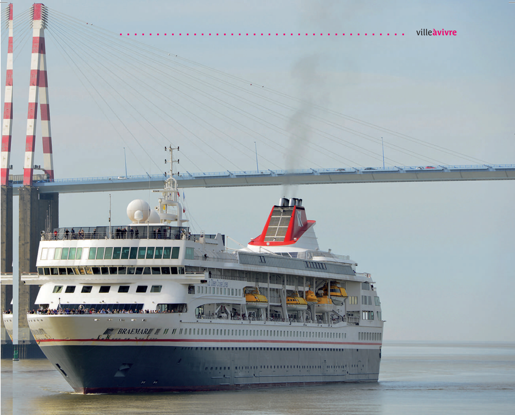
Le Braemar a fait escale sur le quai du port de Montoir avec 1 000 passagers britanniques et 350 hommes d'équipage à son bord.