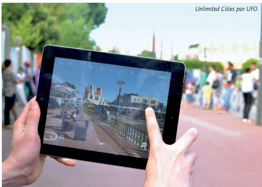
Unlimited Cities par UFO.

À partir de mi-juin, des médiateurs iront à la rencontre des habitants dans les rues, sur les places, à la sortie des écoles... Munis de tablettes, ils vous proposeront de manipuler une