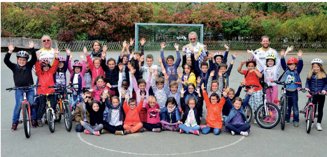
L'école Pierre-et-Marie-Curie a mis en place un Projet Éducatif de Territoire (PEdT) avec un axe « vélo » grâce à la mobilisation de plusieurs partenaires.

Autant d'intervenants qui se sont retrouvés le 4 juin dernier lors du temps fort « La route à vélo » organisé sur la piste de sécurité routière du parc paysager... Avant que le PEdT ne reprenne sa route dès la rentrée de septembre.