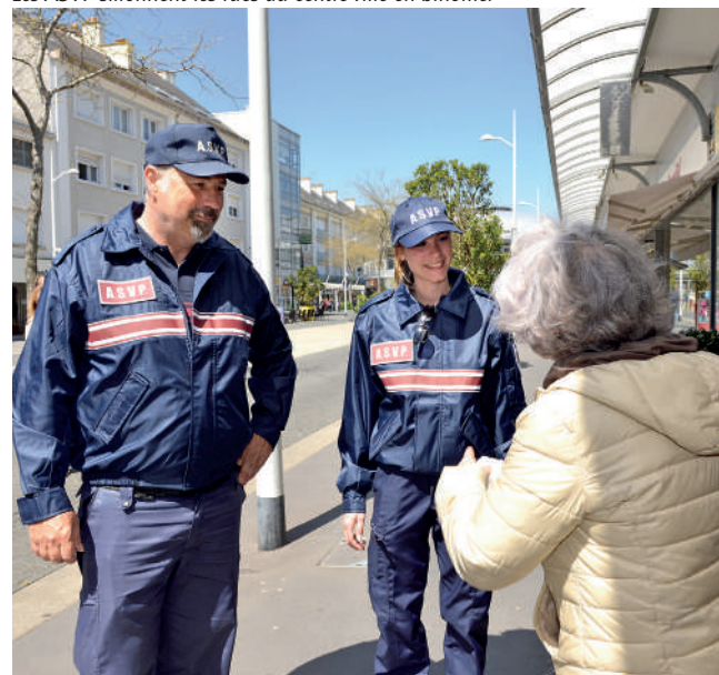
Les ASVP sillonnent les rues du centre-ville en binôme.

Il est à noter que l'État à travers un dispositif d'aide au financement, participera à l'achat de cet équipement.