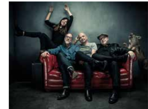
◀ Pixies, le groupe légendaire Rock Punk des années 80/90 ne proposera que 4 dates de concert en France en 2017

Tél : 02 51 10 00 00. www.festival-les-escales.com