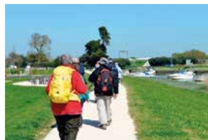
La digue de Méan-Penhoët a été finalisée en octobre dernier. Aménagée dans l'esprit d'un petit front de mer, elle est devenue une destination de balade pour tous.

Avec son talus végétalisé et paysagé sur un hectare, ses merlons d'herbe, ses murets de pierre, son belvédère, son aire de pique-nique, son banc filant de 60 mètres de long et sa halte cyclo-touristique « Loire à vélo », la digue du Brivet aménagée dans l'esprit d'un petit front de mer est donc devenue une destination de promenade pour tous, personnes à mobilité réduite comprises. « C'est bien