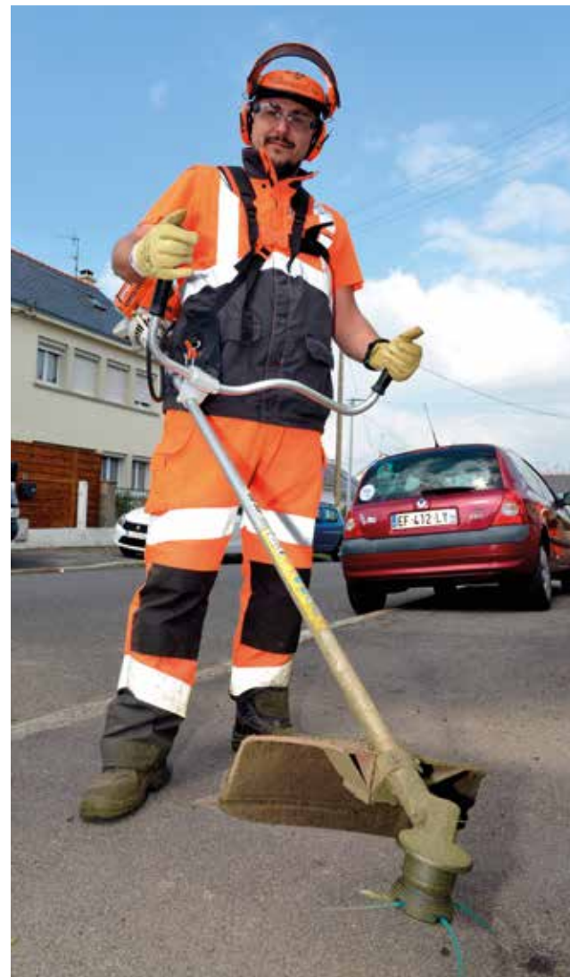
▲ Quatre agents supplémentaires renforcent les équipes pour assurer le désherbage du 1 er avril au 30 septembre.

La Ville de Saint-Nazaire passe au zéro phyto. Elle généralise la fin de l'usage de pesticides pour entretenir ses espaces.