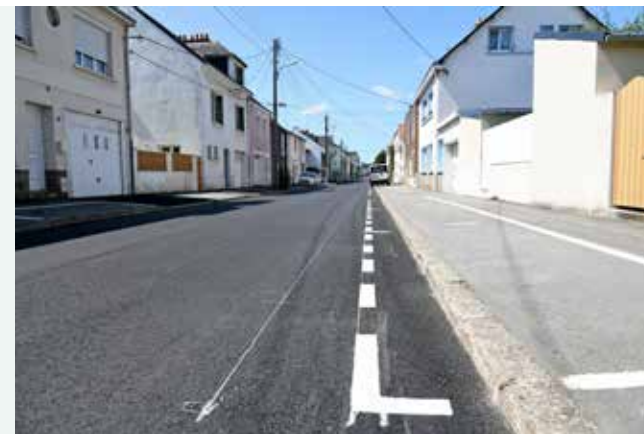
Travaux de voirie rue Jules Guesde (août 2019).