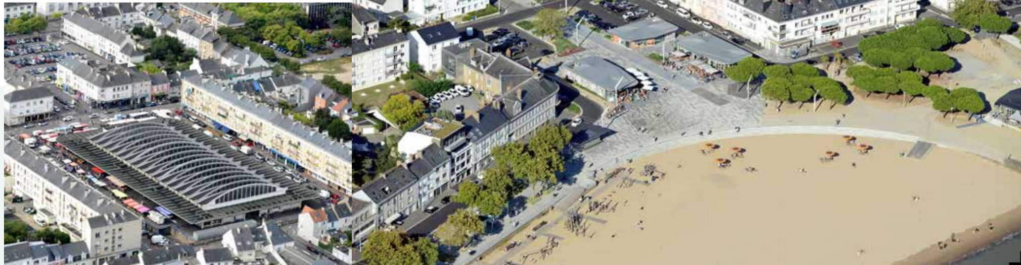
Les halles centrales