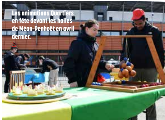
Les animations Quartiers en fête devant les halles de Méan-Penhoët en avril dernier.

Les quartiers en fête reviennent pendant les vacances d'avril : pour la première fois au cœur du quartier d'Avalix du 8 au 10 avril, puis sur la place des Halles de Méan-Penhoët du 15 au 17 avril dès 14h. Ces après-midis ludiques, sportives et culturelles transforment l'espace public en terrain de jeux pour tous. Au programme : jeux en plein air, chasse au trésor, jeu de l'oie géant, initiations sportives avec les clubs nazairiens (roller, boxe, basket, rugby, vélo) et Boccia pour les personnes en situation de handicap moteur. Le CCAS sensibilisera également à la lutte contre l'isolement des personnes âgées. Des concerts gratuits seront proposés chaque soir de 17h30 à 19h, avec une programmation variée (latino, afro-électro, chanson française, musique du monde). Scène ouverte et karaoké l'après-midi offriront à chacun l'occasion de montrer ses talents. Ces animations gratuites sont l'occasion de passer un moment convivial en famille ou entre amis.