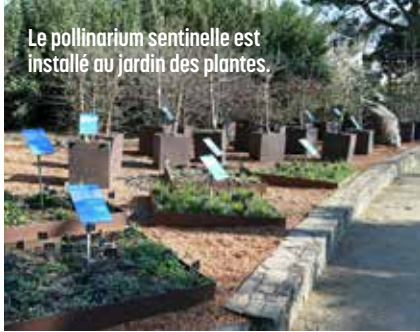
Le pollinarium sentinelle est installé au jardin des plantes.

Vous souffrez d'allergies aux pollens ? Il est possible de suivre en temps réel les émissions de pollens grâce à un service gratuit proposé par le site « alertepollens » . En vous inscrivant, vous recevez par courriel des alertes sur la présence de pollens dans l'air, dès les premiers signes.