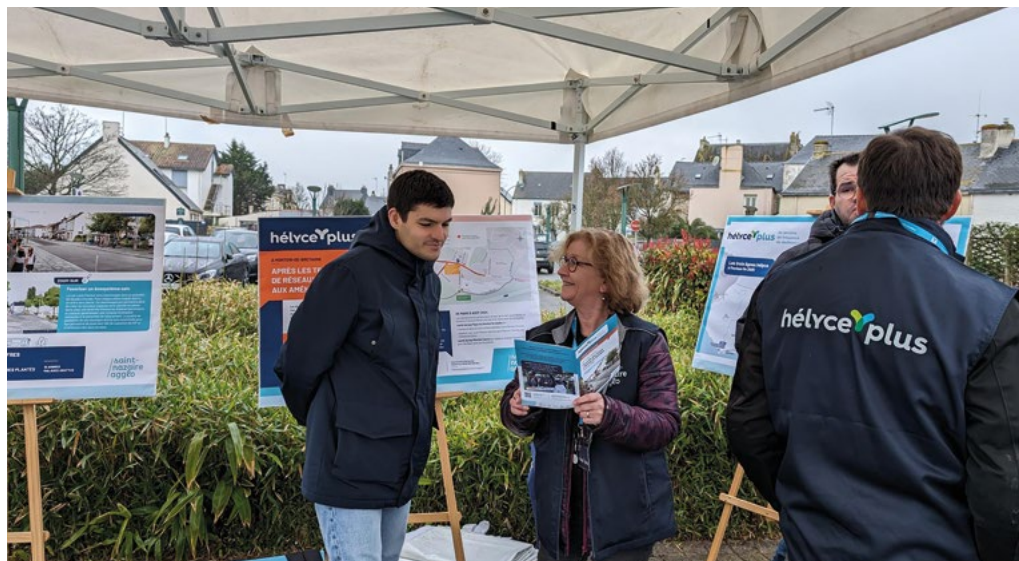
© Ostry et associés - Impression : La Nouvelle Imprimerie 44350 Guérande SENSE - 1889 - Saint-Nazaire Agglomération - Mai 2024

Pour vous tenir informé des dernières actualités et poser vos questions, rendez-vous sur helyceplus.fr