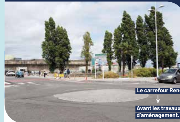
Le carrefour René Coty / Légion d'Honneur

À ce carrefour, c'est aussi le parcours des cyclistes et des piétons qui sera amélioré pour plus de sécurité et de fluidité. Les travaux démarreront fin août pour se terminer fin octobre. Plus d'informations pages suivantes.